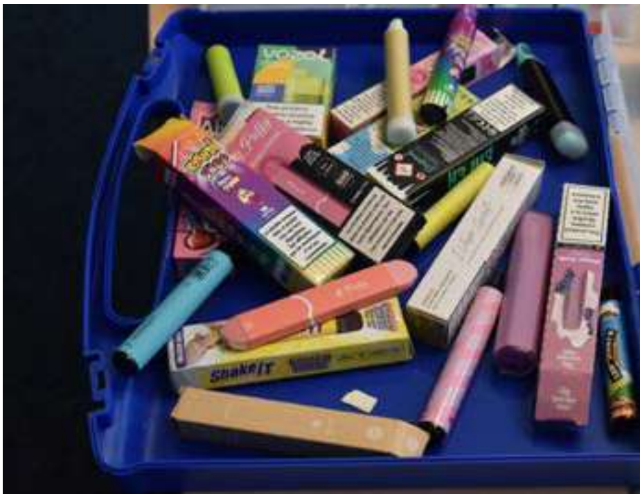
Les «puffs», c'est pernicieux !

cola, licorne, mojito, barbe à papa, choco-noisette - leurs formes, leurs couleurs flashy et leur côté pratique. De plus, c'est meilleur marché que les cigarettes classiques... Les fabricants visent le porte-monnaie des jeunes ! Mais les effets sur la santé sont là : addiction, risques d'infection buccales, inflammation des voies respiratoires... De plus, c'est une catastrophe écologique», estime Véronique Pittet. Les puffs à usage unique, avec leur batterie au lithium et leurs matières plastiques, atterrissent souvent dans la nature. Ce sont des polluants contenant des substances toxiques, un fléau environnemental !