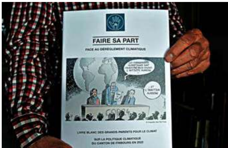
Fribourg Livre Blanc des Grands-Parents pour le climat

L'Association suisse des Grands-parents pour le climat est née en 2014 de la préoccupation d'une génération, celle des grands-parents, face aux risques de détérioration des conditions de vie sur terre. Elle compte aujourd'hui environ 2'300 membres en Suisse, dont quelque 120 dans le canton de Fribourg, essen-