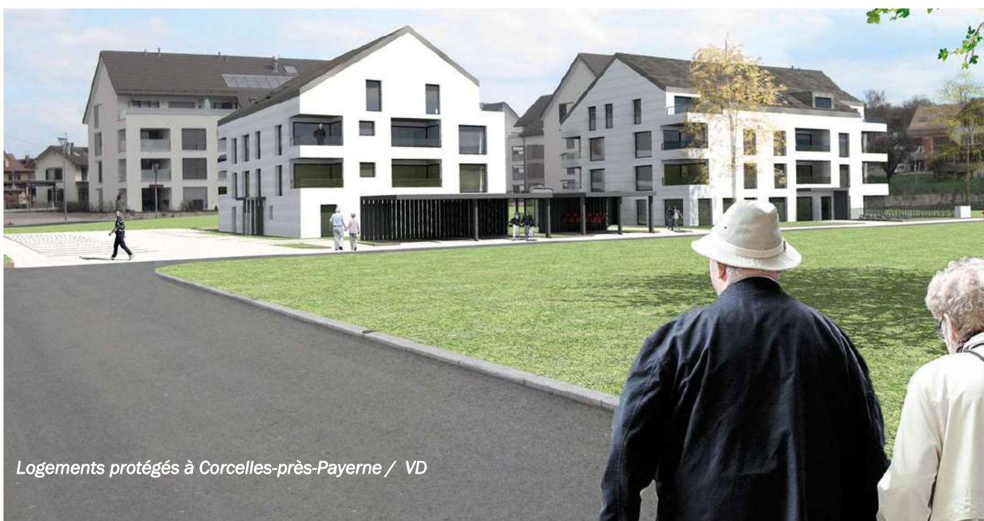
Logements protégés à Corcelles-près-Payerne / VD